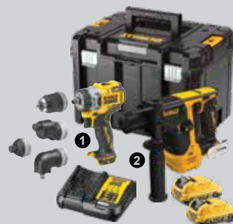
KIT 2 OUTILS XR 12V 3AH LI-ION BL