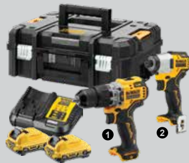
KIT 2 OUTILS XR 12V 3AH LI-ION BL

Livré avec 2 batteries, chargeur, clips ceinture, coffret TSTAK.