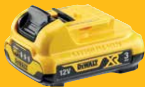
BATTERIE XR 12V 3AH LI-ION DCB124-XJ 55 €HT*