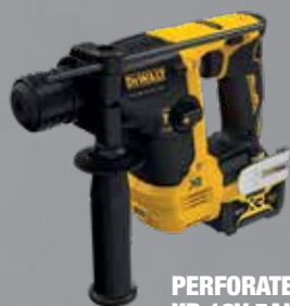
PERFORATEUR SDS-PLUS XR 12V 5AH LI-ION BL DCH072L2-QW

Force de frappe (E.P.T.A.) : 1.1J Régime à vide : 0-910 tr/min Cap. de perçage max. bois / béton / métal : 14 / 13 / 10 mm Cadence de frappe : 0-4600 cps/min Niveau de vibrations : 9.7 m/s 2 Poids (sans batterie) : 1.7 kg Livré avec 2 batteries, chargeur, poignée latérale multi-positions, coffret TSTAK.