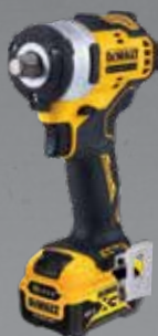
BOULONNEUSE 1/2" XR 12V 5AH LI-ION BL DCF901P2-QW

Couple max. : 340 Nm Régime à vide : 0-2850 tr/min Cadence de frappe : 0-3250 imp/min Poids (sans batterie) : 1.1 kg Livrée avec 2 batteries, chargeur, clip ceinture, coffret TSTAK.