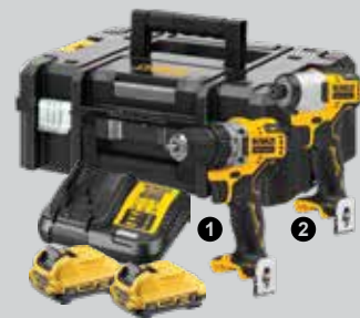
KIT 2 OUTILS XR 12V 3AH LI-ION BL

Livré avec 2 batteries, chargeur, clips ceinture, coffret TSTAK.