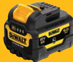
BATTERIE XR 12V 5AH LI-ION COQUE RENFORCÉE DCB126G-XJ 85 €HT*