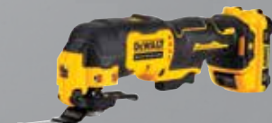
MULTI-CUTTER XR 12V 2AH LI-ION BL DCS353D2-QW

Angle d'oscillation : 1.6° Régime à vide : 0-18000 ocs/min Changement d'accessoires sans outil : Oui Poids (sans batterie) : 0.9 kg Livré avec 2 batteries, chargeur, 1 butée de profondeur, 1 extracteur de poussière, 1 adaptateur universel, coffret TSTAK. + 31 accessoires : 1 plateau de ponçage et 25 abrasifs, 1 lame bois, 1 lame métal, 1 lame de détail, 1 lame semi-circulaire de coupe, 1 lame semi-circulaire grattoir.