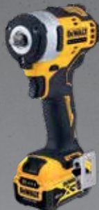
BOULONNEUSE 3/8" XR 12V 5AH LI-ION BL DCF903P2-QW

Couple max. : 340 Nm Régime à vide : 0-2850 tr/min Cadence de frappe : 0-3250 imp/min Poids (sans batterie) : 1.1 kg Livrée avec 2 batteries, chargeur, clip ceinture, coffret TSTAK.