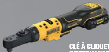
CLÉ À CLIQUET À TÊTES INTERCHANGEABLES XR 12V 3AH LI-ION BL DCF500L2G-QW

Têtes : 1/4", 3/8" et Hex 1/4" Couple max. : 75 Nm Régime à vide : 0-450 tr/min Poids (sans batterie) : 0.9 kg Livrée avec 2 batteries renforcées, chargeur, mousse pour servante.