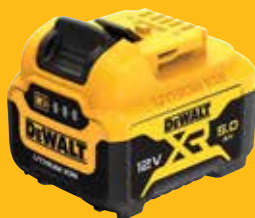
BATTERIE XR 12V 5AH LI-ION DCB126-XJ 75 €HT*