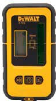
Detector de Línea Láser