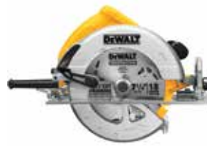
Sierra Circular 7-1/4"

Cuenta con Soplador y Cable Ajustable a 2 Posiciones / Guarda super-resistente de 3 mm de espesor / Diseño de guarda con pestaña que permite cortes en todos los ángulos sin atascarse.