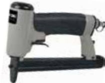
PORTER + CABLE. Engrapadora de Tapicería Calibre 22

Gatillo de doble acción, se puede elegir modo de repetición o modo individual / Cuerpo de aluminio para mayor resistencia y menor peso / Cargador de grapas de fácil visualización.