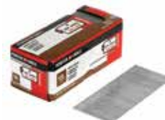
PORTER + CABLE. Clavo Calibre 18 Longitud 2"