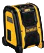
DCR006 Altavoz Bluetooth® para Lugar de Trabajo