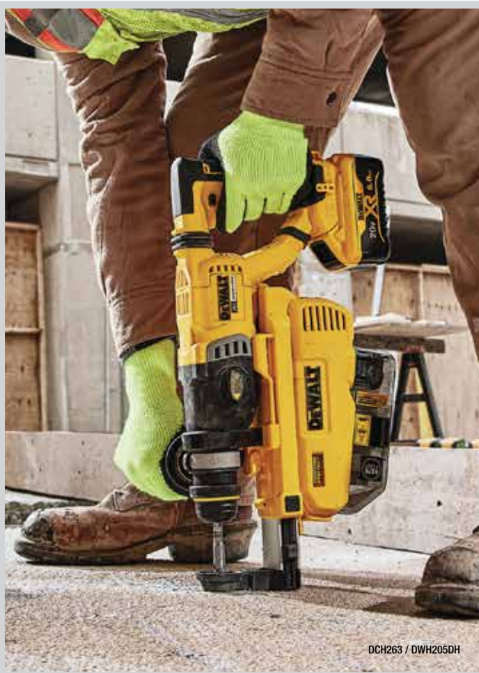
DCH263 / DWH205DH