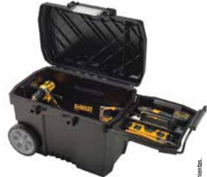
Arcón Rodante 15 galones