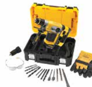
Rotomartillo SDS Plus 1-1/4" con Accesorios

Embrague de Seguridad en caso de que la broca se atasque / Plataforma Perform & Protect, reduce al máximo la vibración / Diseño compacto, ligero y ergonómico.