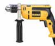
Rotomartillo 1/2" VVR

Compacto y ligero para una mayor comodidad / Interruptor electrónico sellado contra el polvo / Diseño de la carcasa tipo Jampot contorneado y ergonómica.