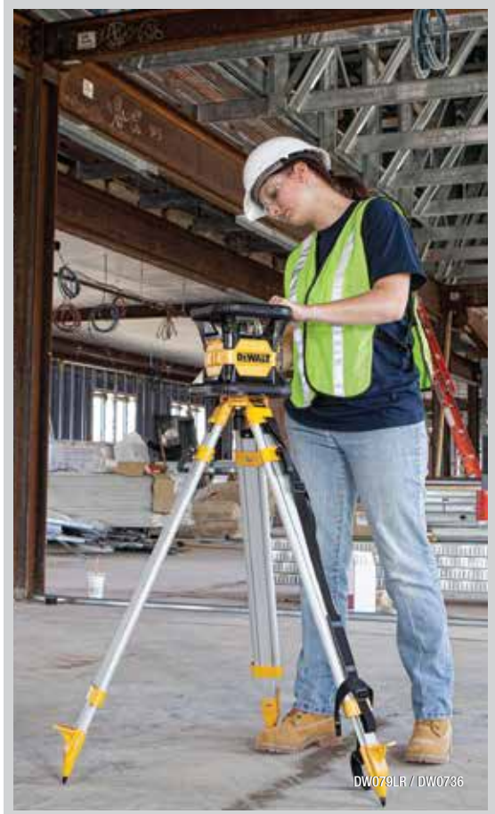
DW079LR / DW0736

DW0881T Tripié de 1/4" con Manivela / Rosca de 1/4" x 20