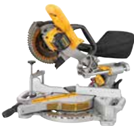
DCS361B Sierra de Inglete 7-1/4" Telescópica