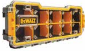
Organizador PRO 10 Compartimentos