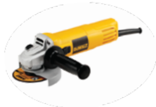
Esmeriladora Angular 4 1/2" Velocidad Variable

Sistema de ventilación avanzado que prolonga la vida del motor / Interruptor deslizando / Bloqueo del eje para cambios rápidos del disco