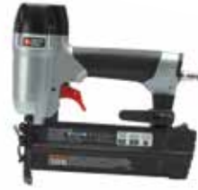
PORTER + CABLE. Clavadora Neumática Calibre 18

Alimentador de doble carga / Punta de contacto que permite mayor visibilidad y durabilidad / Salida de aire a 360° expulsa el aire a presión y polvo lejos del usuario.