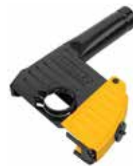
Guarda extractora de polvo 5" / 6"

Rotor y estátor cubiertos con resina epóxica para evitar abrasión / Carbones de conexión automática / Motor diseñado para rápida eliminación de material y protección de sobrecarga.