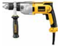
Rotomartillo 1/2" VVR

Velocidad variable y reversible / Empuñadura de goma para más comodidad / Mango lateral de 360 grados con varilla de profundidad.