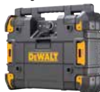
DWST17510 Radio cargador TSTAK®