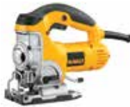
Sierra Caladora Orbital de Velocidad Variable

Acción pendular de 4 posiciones / Innovador sistema de cuchilla al filo para cortes exactos / Mecanismo de contrapeso que reduce la vibración.