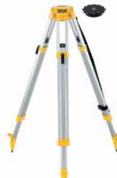
Tripié de Uso Rudo