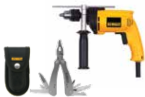
Rotomartillo 1/2" VVR + Multiherramienta

Construido 100% con rodamientos de bolas y rodillos para mayor vida / Diseño contorneado y ergonómico.