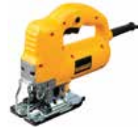
Sierra Caladora Orbital de Velocidad Variable

Selector de velocidad de 7 posiciones para mayor control / Ajuste de bisel sin herramientas permite cortes en ángulo / Luz LED para mayor iluminación.