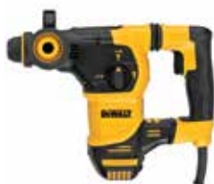
Rotomartillo SDS Plus 1-1/4" BRUSHLESS

Embrague de Seguridad en caso de que la broca se atasque / Plataforma Perform & Protect, reduce al máximo la vibración / Diseño compacto, ligero y ergonómico.