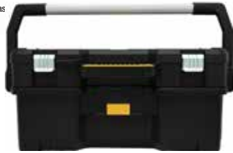
Caja Abierta con Portafolio para Herramienta Eléctrica Desmontable