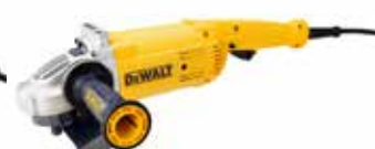
Esmeriladora Angular 7"

Bloqueo de eje para cambiar discos fácil y rápidamente / Ventana de acceso directo a los carbones para mayor comodidad / Mango lateral con 2 posiciones para ajustarse a cualquier situación.