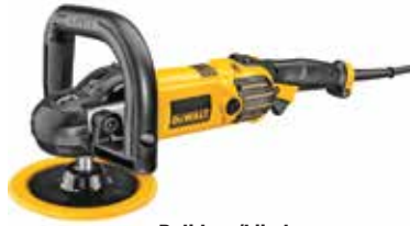
Pulidora/Lijadora Angular 7" y 9"

Velocidad variable / Sistema de Acabado Controlado SAC con arranque suave, controla electrónicamente la velocidad bajo carga / Filtros contra la absorción de residuos de lana en las entradas de aire.