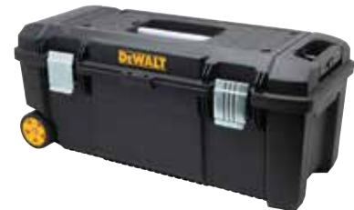
Arcón Rodante 12 galones