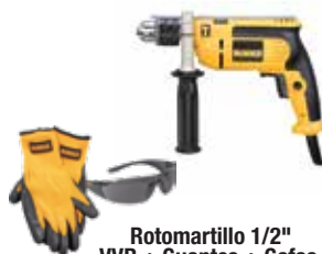
Rotomartillo 1/2" VVR + Guantes + Gafas

Construido 100% con rodamientos de bolas y rodillos para mayor vida / Diseño contorneado y ergonómico.