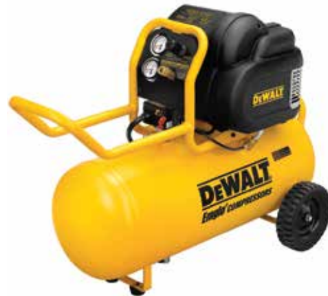
Compresor Horizontal 1.8 HP 15 Gal 200 PSI

5.4 SCFM a 90 PSI permite un tiempo de recuperación rápido / Diseño único de marco lateral protege todos los componentes / Drenaje.