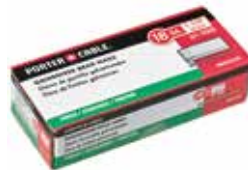
PORTER + CABLE. Clavo Calibre 18 Longitud 1 1/4"