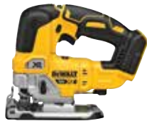
DCS334B Sierra Caladora Sin Carbones XR®