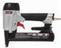
PORTER + CABLE. Engrapadora Neumática Calibre 18

Gatillo de doble acción, se puede elegir modo de repetición o modo individual / Cuerpo de aluminio para mayor resistencia y menor peso / Cargador de grapas de fácil visualización.