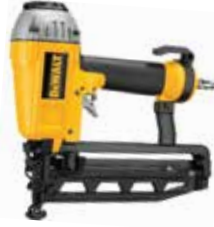
Clavadora Neumática Calibre 16

Para clavos hasta 2 pulgadas / Motor sin necesidad de mantenimiento / Mecanismo de liberación para atascos de clavos.