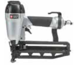
PORTER + CABLE. Clavadora Neumática Calibre 16

Punta de Nariz removible que no deja marcas / Motor sin mantenimiento / Disparador de estilo secuencial.