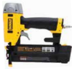
Clavadora Neumática Calibre 18

Para clavos hasta 2 pulgadas / Motor sin necesidad de mantenimiento / Mecanismo de liberación para atascos de clavos.