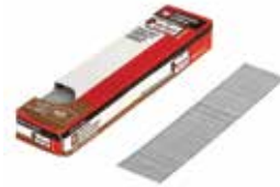
PORTER + CABLE. Clavo Calibre 18 Longitud 1"