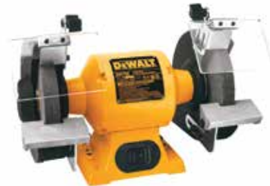
Esmeril de Banco de 8"

Motor de inducción de 3/4 HP para esmerilados industriales / Base y motor de hierro fundido / Soportes de aluminio maquinados a precisión.