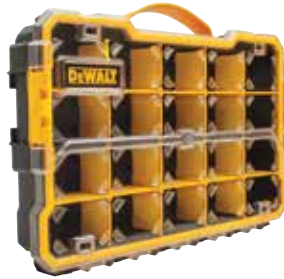
Organizador PRO 20 Compartimentos