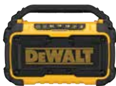
DCR010 Altavoz Bluetooth® para Lugar de Trabajo