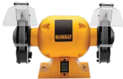
Esmeril de Banco de 6"

Motor de inducción de 1/2 HP para esmerilados industriales / Base y motor de hierro fundido / Soportes de aluminio maquinados a precisión.