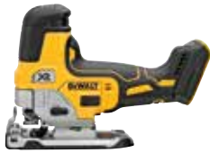
DCS335B Sierra Caladora Sin Carbones XR®