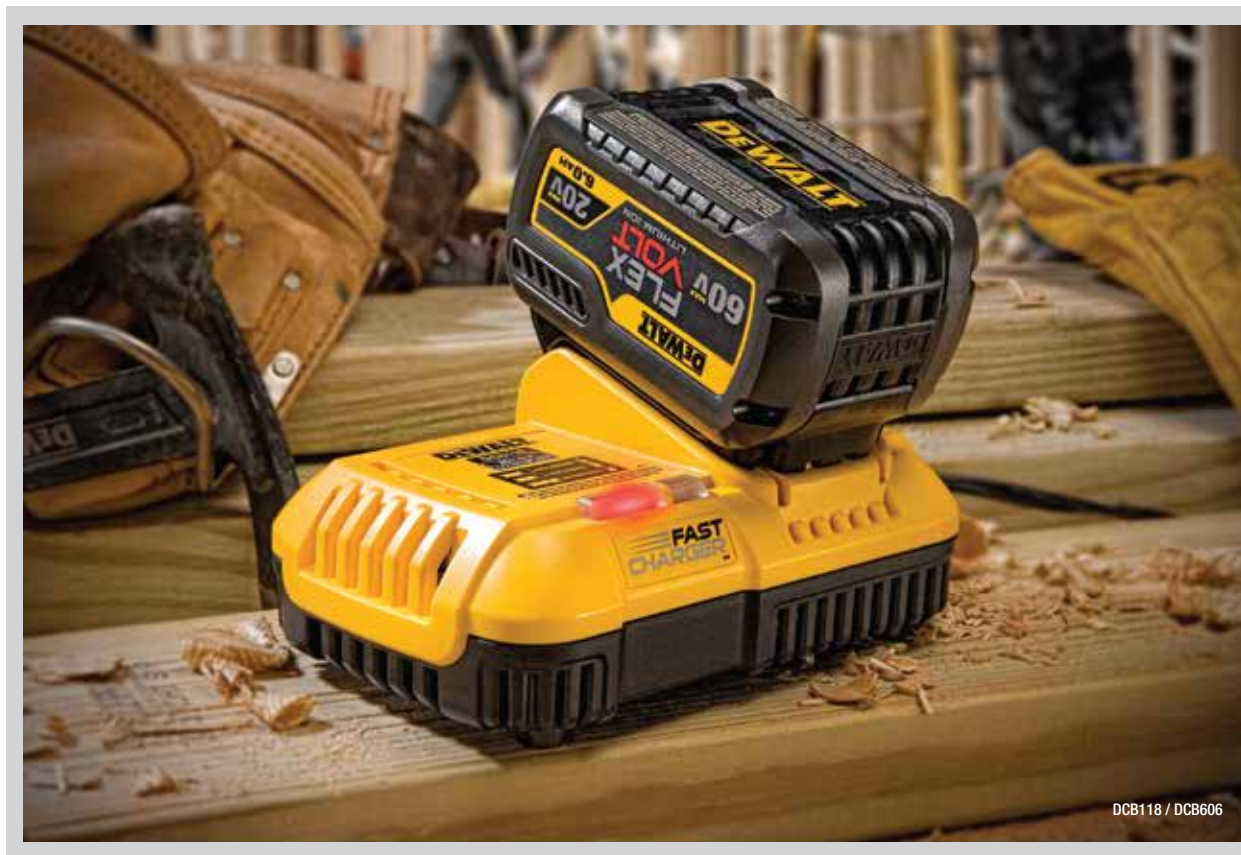
DCB118 / DCB606