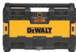
DWST08810 Radio Cargador TOUGHSYSTEM®