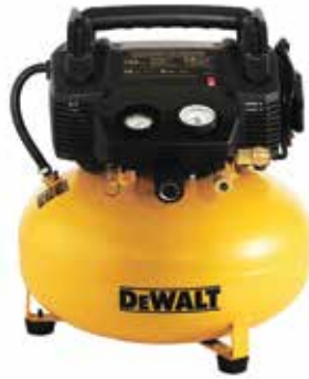
Compresor Pancake 165 PSI con Accesorios

Motor de inducción de bajo consumo / Regulador de presión HIGH FLOW / Protección de sobrecarga