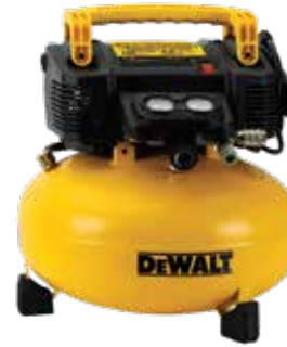
Compresor Pancake 165 PSI

Motor de inducción de bajo consumo / Regulador de presión HIGH FLOW / Protección de sobrecarga