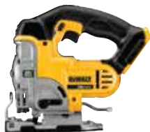
DCS331B Sierra Caladora 20V MAX*