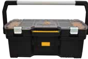
Caja Abierta con Organizador Desmontable