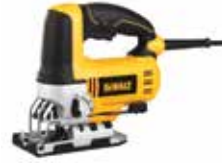
Sierra Caladora Orbital de Velocidad Variable

Sistema de cambio rápido de segueta / Acción orbital de 4 posiciones / Zapata biselada de 0 a 45 grados en ambas direcciones.