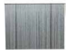
PORTER + CABLE. Clavo Calibre 16 Longitud 1 1/2"