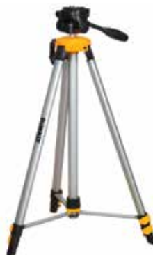
Tripié de 1/4" con Manivela