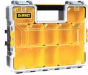
Organizador PRO 10 Contenedores