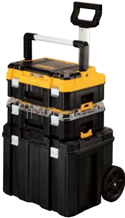
TORRE MÓVIL MODULAR TSTAK®