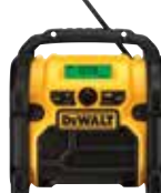
DCR018 Radio Compacto para Lugar de Trabajo