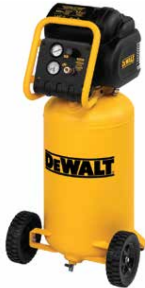
Compresor Vertical 1.8 HP

5.4 SCFM a 90 PSI permite un tiempo de recuperación rápido / Diseño único de marco lateral protege todos los componentes / Drenaje.