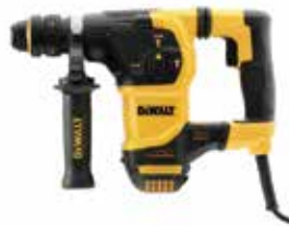
Rotomartillo SDS Plus 1-1/4" BRUSHLESS con Broquero de 1/2" de Acople Rápido

Embrague de Seguridad en caso de que la broca se atasque / Plataforma Perform & Protect, reduce al máximo la vibración / Diseño compacto, ligero y ergonómico.