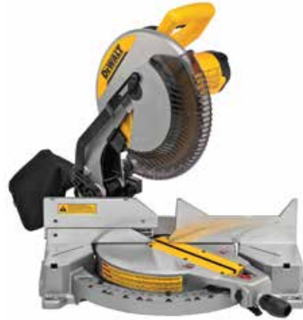
Sierra Ingleteadora 12\"/>

Escalas de ángulos de bisel e inglete grabadas sobre placas independientes / Guía posterior alta y ajustable / Corte transversal: 346mm: mayor capacidad en su clase.