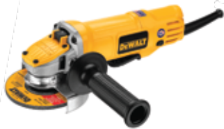
Esmeriladora Angular 4½" 220 V

Sistema de ventilación que proporciona flujo de aire máximo / Bloqueo de eje para cambios rápidos de discos / Compacta caja de engranajes que permite su uso en espacios reducidos.