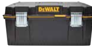
Caja de Herramienta 23"