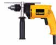
Rotomartillo 1/2" VVR

Doble rango de velocidad variable y reversible / Doble modo: taladro (madera y metal) y rotomartillo (concreto y mampostería) / Protección contra sobre carga.