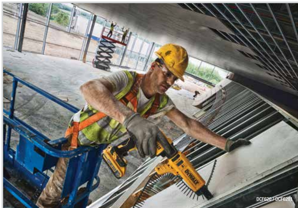
DCF620 / DCF6201