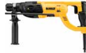
Rotomartillo SDS Plus 1"

Embrague de Seguridad en caso de que la broca se atasque / Mango de agarre tipo pistola / Velocidad Variable y Reversible.