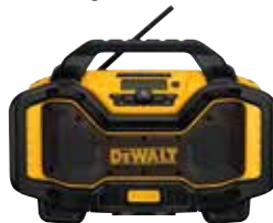
DCR025 Radio cargador Bluetooth®