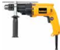
Rotomartillo 1/2" Doble VVR

Velocidad variable y reversible / Empuñadura de goma para más comodidad / Mango lateral de 360 grados con varilla de profundidad.