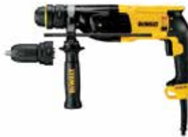
Rotomartillo SDS Plus 1" con Broquero de 1/2"

Ideal para trabajos en hormigón o mampostería desde 4 a 26mm de diámetro / Embrague de seguridad en caso de que la broca se atasque / Velocidad Variable y Reversible.