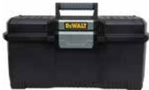
Caja One Touch